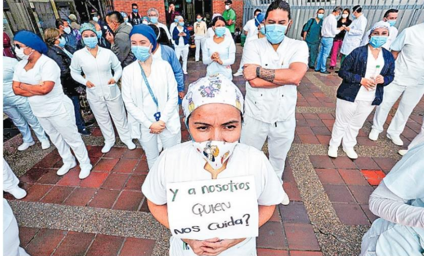
Imagen 7. Proceso verbal en El Tiempo , 14/04/2020

Como se ha dicho, en casi la totalidad de las imágenes se presentan participantes representados. Llama la atención la aparición de la mujer en posición de liderazgo en procesos no transaccionales relacionados con la crisis carcelaria, la asistencia médica, la protesta social y el retorno al trabajo. Esto se observa en 12 del total de las fotografías (9 en El Tiempo y 3 en El Espectador ) y refleja la intención de hacer visible el papel protagónico de la mujer en situaciones coyunturales de la emergencia sanitaria. Esto contrasta con lo observado en las reacciones no transaccionales, pues mientras El Espectador enfatiza en el sufrimiento de las personas, El Tiempo lo hace en el papel de liderazgo ejercido preferentemente por la mujer.