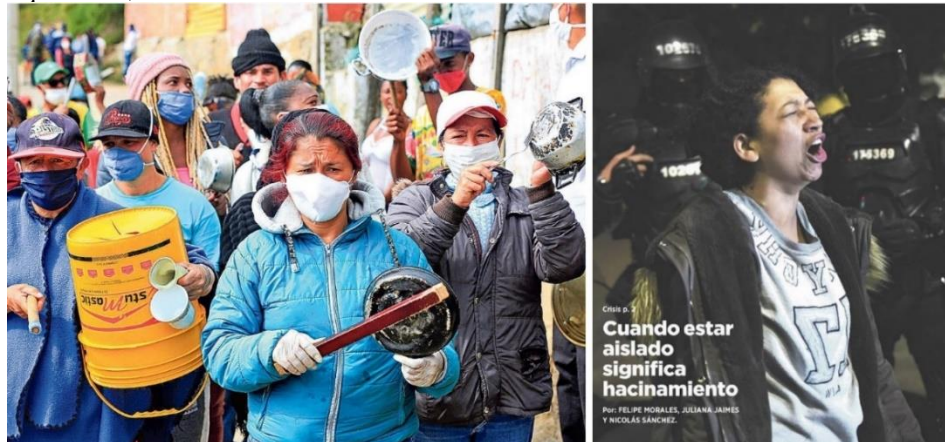
Imagen 2. Estatus de igualdad independiente en El Tiempo (izquierda), 16/04/2020; y El Espectador , 23/03/2020

Las mayores diferencias en cuanto a las relaciones de estatus entre los dos periódicos se observan en el campo de la desigualdad. El Tiempo (5 títulos), más que El Espectador (3 títulos), subordina la imagen al texto, es decir, que la fotografía muestra apenas una parte del contenido de la cláusula, como se observa en la foto de la izquierda de la imagen 3, que muestra a personas haciendo compras en el día sin IVA, pero el texto amplía la información hacia aspectos negativos del evento como los tumultos (T16ET: Tumultos, gran lunar de un día que le dio un respiro al comercio ). En El Espectador se observa esto mismo con la foto de la derecha en la imagen 3, que muestra a dos hombres orando, pero el texto hace referencia a aspectos más amplios de hecho noticioso, especialmente en el sumario (T7EE: Más allá de la fe ). De esta