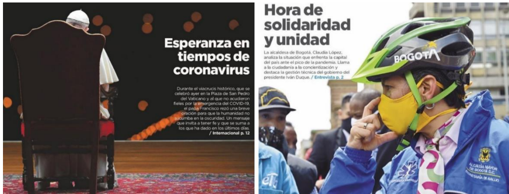
Imagen 5. Relación de proyección en El Espectador , 12/07/2020 y 11/04/2020

Al igual que lo observado en las relaciones de estatus, en el análisis de las relaciones lógico-semánticas también se observan coincidencias en los dos diarios. Esto se presenta en siete de los titulares analizados, en los que los medios acudieron al mismo tipo de relación (4 de extensión, 2 de ejemplificación y 1 de exposición) para presentar situaciones acerca de la crisis carcelaria, la migración de venezolanos, la Semana Santa sin feligreses, la recuperación de pacientes contagiados por Covid-19, la recuperación económica y la declaratoria de cuarentenas. Esto sugiere cierta homogeneidad a la hora de enfocar los temas en la dirección de lo que plantean las fuentes.