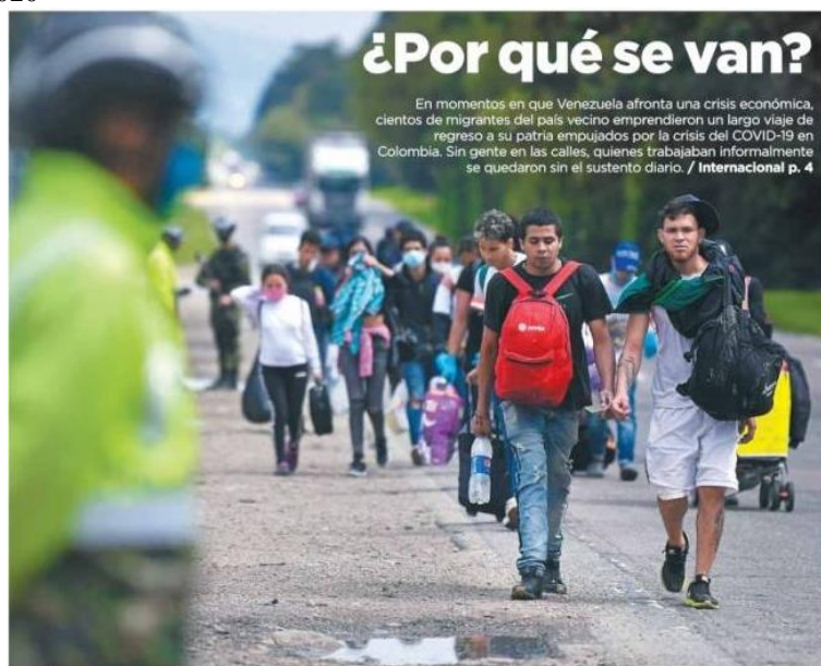
Imagen 1. Cláusula con participante elidido en relación con la foto, en El Espectador , 06/04/2020

El análisis de la función ideacional en las fotografías se abordó en dos momentos: primero, para determinar los tipos de participantes (interactivos o representados), los tipos de proceso (transaccionales y no transaccionales) y las circunstancias (entorno, medios y acompañamiento). Se aplicaron criterios de vectorización en procesos narrativos y criterios de clasificación en estructuras analíticas a modo de procesos relacionales de atributo (“parte de”) y de identificación (“tipo de”).