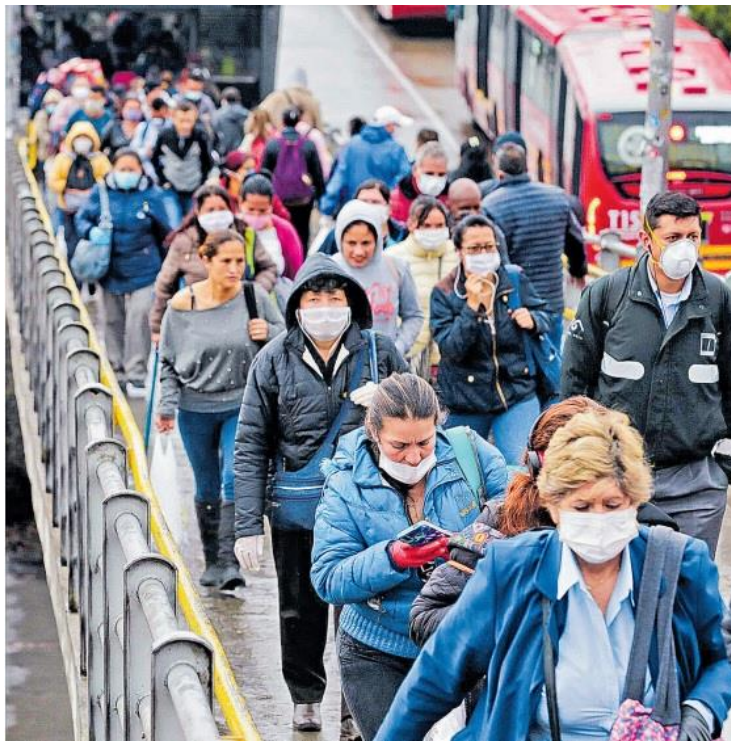
Imagen 8. Circunstancia de entorno en El Tiempo , 25/03/2020

La circunstancia de acompañamiento es menos relevante, pero significativa (en 21 de las imágenes). Refleja la presencia de participantes que no interactúan, de modo que se representan acciones de grupo cuyo objetivo (Meta) no aparece en la imagen. Esto es fuertemente visible en los eventos relacionados con el