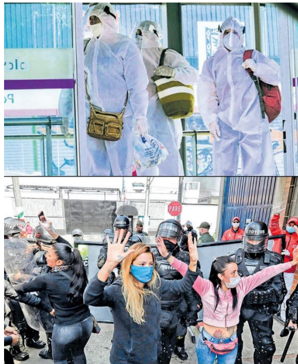
Imagen 9. Circunstancia de medios en El Tiempo , 23/03/2020 y 17/05/2020

En el conjunto de los elementos que hacen parte de la circunstancia de medios (14 imágenes), es decir, las herramientas, utensilios o armas que emplean los actores en desarrollo de sus acciones, aparecen con fuerte recurrencia los barbijos, los guantes y los trajes aislantes como elementos de cuidado personal. Las armas y los trajes de protección de los guardias penitenciarios aparecen como medios en escenas de vigilancia y represión (imágenes 9 y 10).