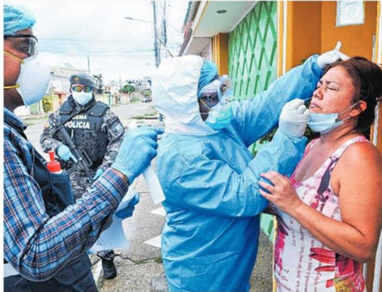
Imagen 6. Proceso transaccional de conversión en El Tiempo , 20/04/2020

Una de las fotografías (imagen 7) se analizó como proceso verbal, pero también puede corresponder a un proceso no transaccional que presenta una protesta del personal médico hospitalario. El elemento que lleva a considerar el proceso verbal es el letrero que porta el participante con mayor peso en la composición gráfica. En este caso, la imagen ofrece un significado complementario al de la cláusula (T9ET: Llamado obligatorio a los médicos será escalonado y en caso extremo ), en el sentido de que el “llamado del gobierno” encuentra resistencia en el personal médico.